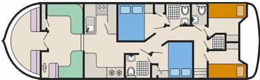
Tower - 1325FB A

Capacidad 12 personas recomendado para 8